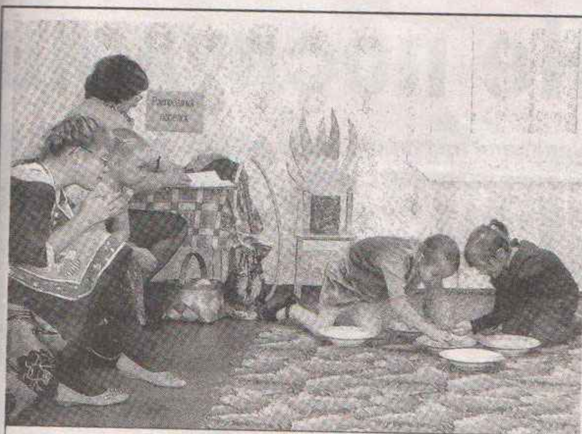
На осеннем празднике было много конкурсов и игр