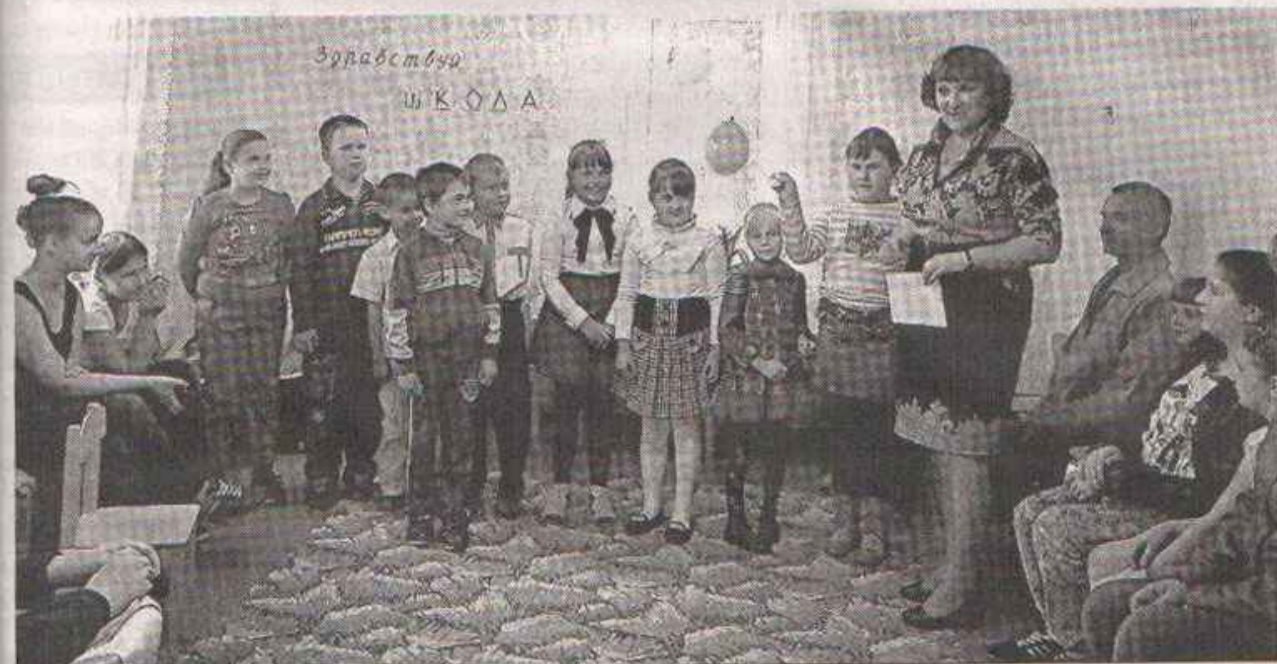
Дети хором обещают учиться на «пятёрки»

Лень обескуражена. В этом зале ей помощников не нашлось. Посрамлённая она уходит, а будущие первоклассники получают подарки, приготовленные спонсорами.